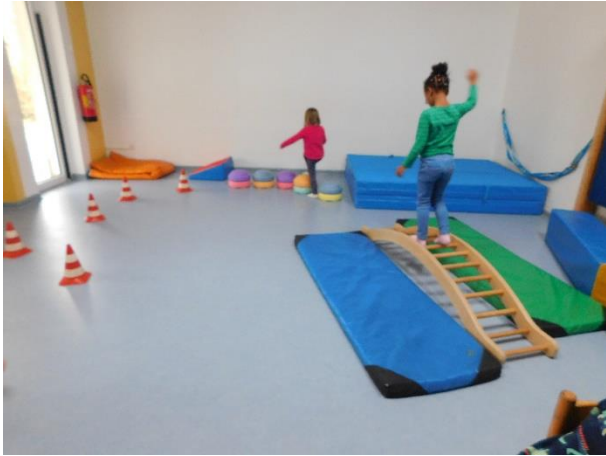
Im Bewegungsraum gab es einen Hindernisparcours